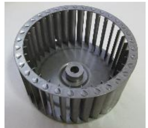
Рабочее колесо (крыльчатка) нерж. ст.